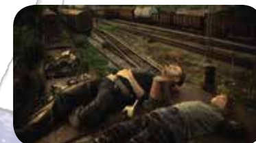
Director of the film