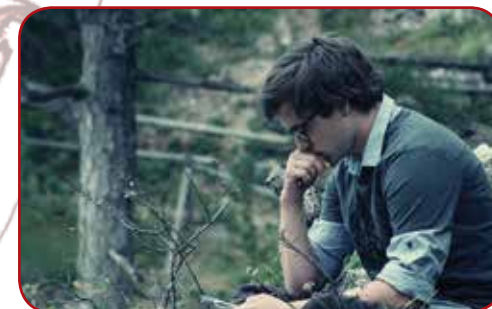
Director of the film