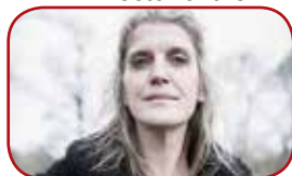
Director of the film