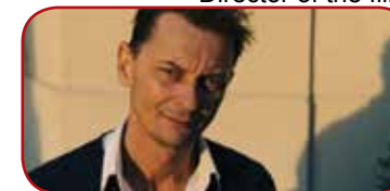
Director of the film

Marseille, a multicultural city. Max is a cheerful teenager who lives illegally with her Congolese family. Lenny meets Max while she is rehearsing her rapping in secret. Rap is the language of her soul, and music will be the bond that unites the two girls. Max and Lenny is the story of a friendship between two girls fighting for survival in a northern area of Marseille.