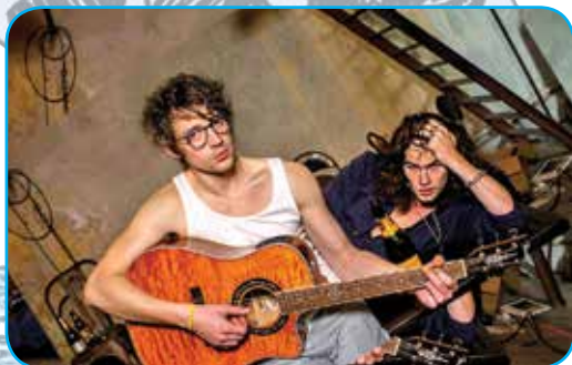
Directors of the film