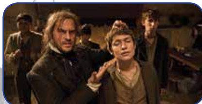
Director of the film