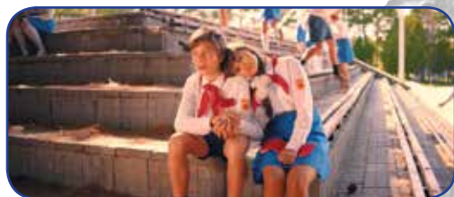
Director of the film