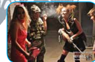
Director of the film